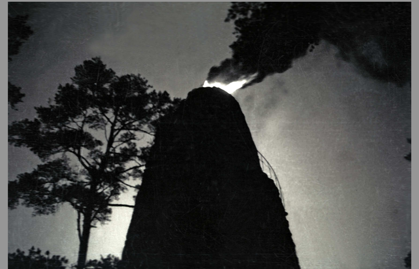
Jaanituli torni tipus 1956. aastal