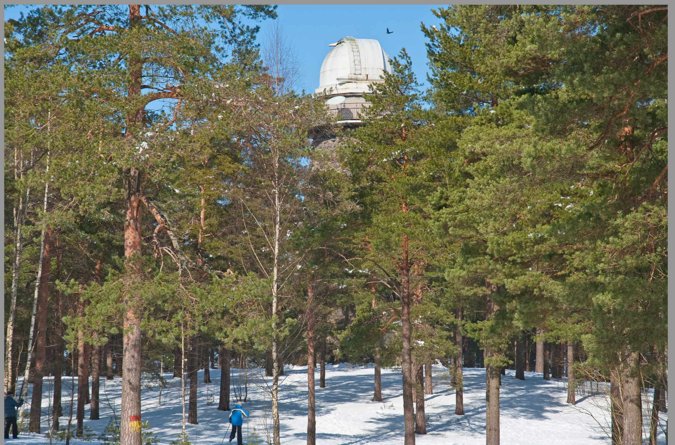
Tallinna Tähetorn 2009. aastal