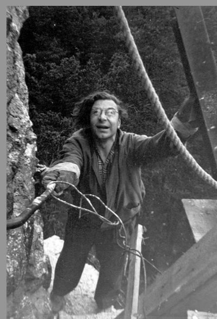
Ch. Villmann ehitusel