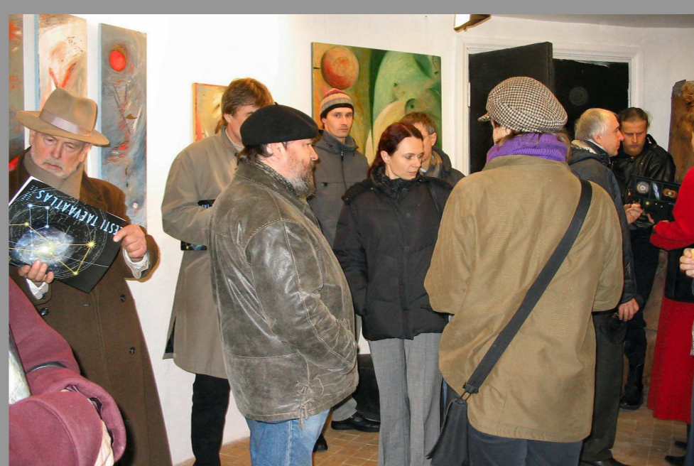
"Astro-art" näitus 2004. aastal