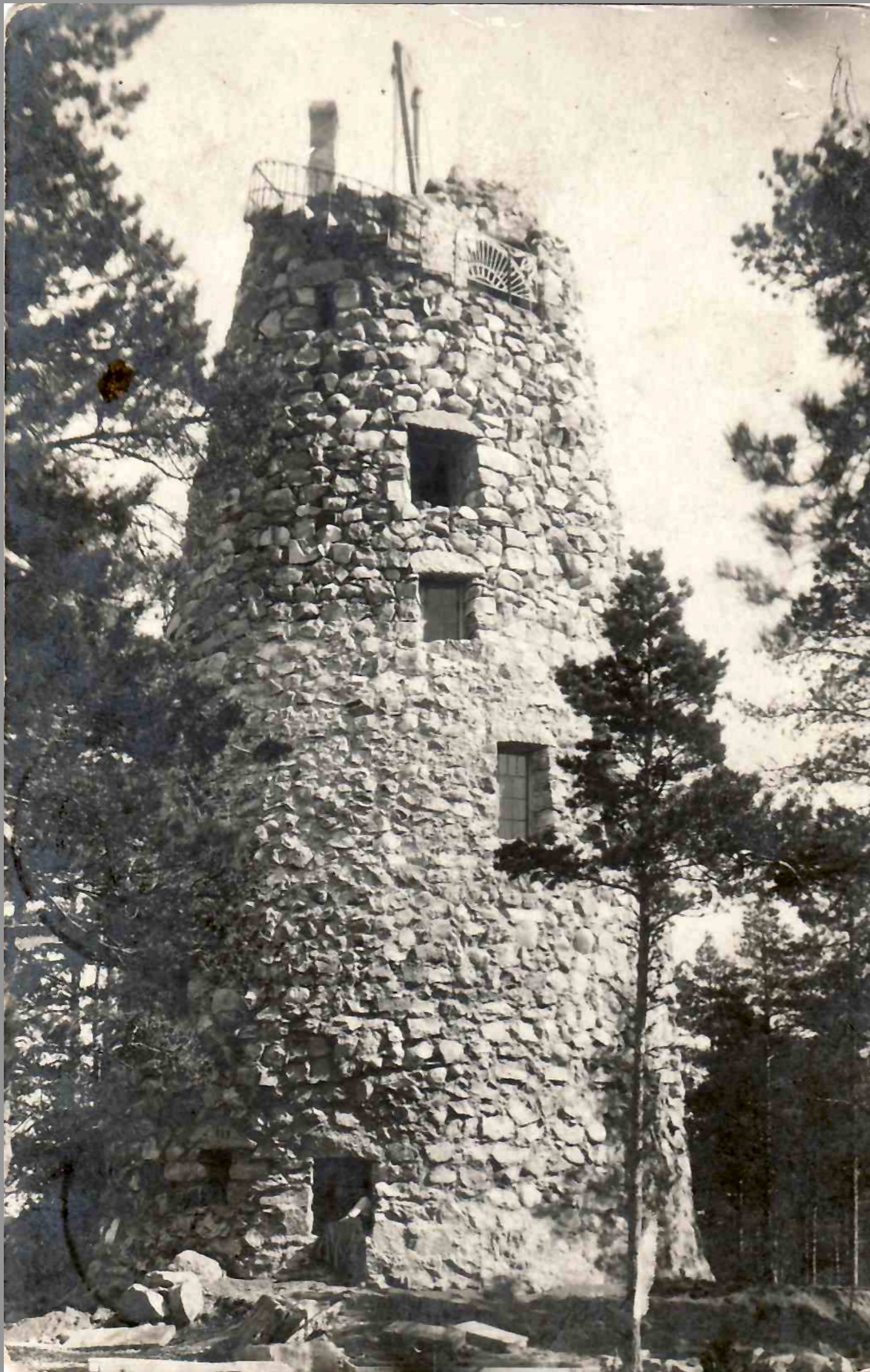
Glehn'i torn 1910. aastal