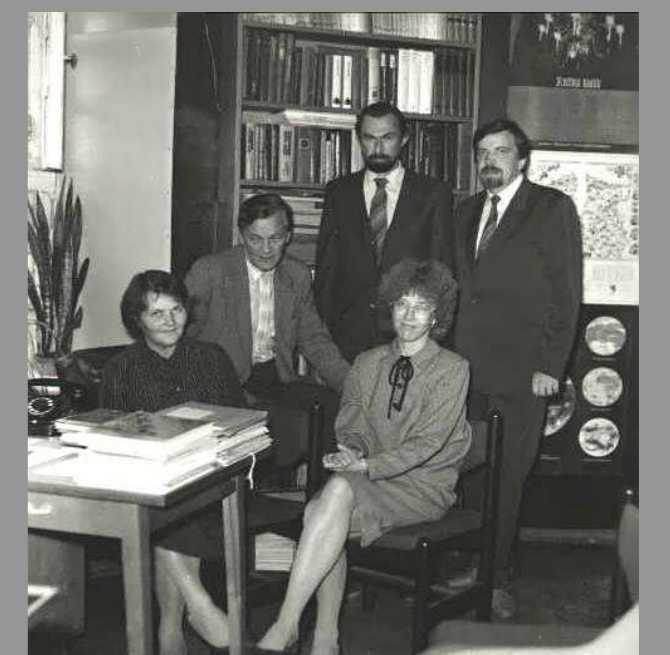
Ühispilet enne suurt koondamist 1992. a.