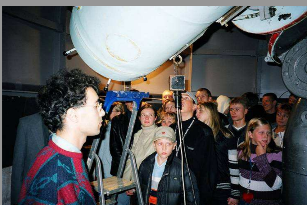
Mars'i vaatlused 2004. aastal