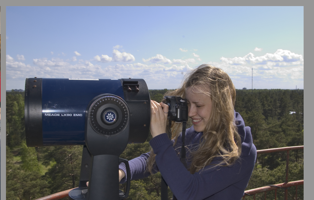
Õppevaatlus 2007. aastal